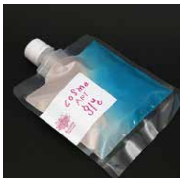
海をイメージした OCEAN (オーシャン)