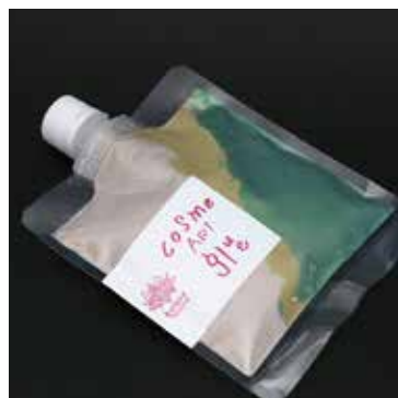
自然をイメージした NATURE (ネイチャー)