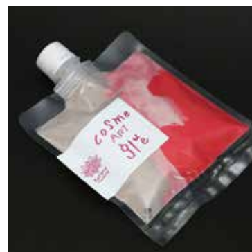
赤とピンクの LOVE (ラブ)