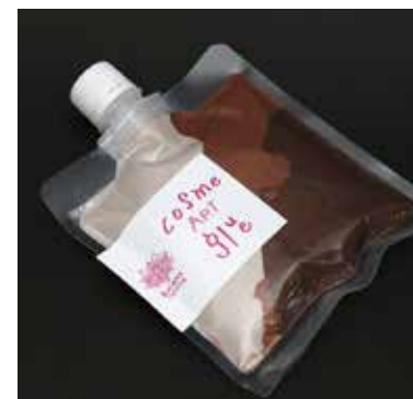
力強い大地を表現 SOIL (ソイル)